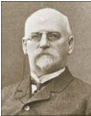
С. С. Могилевцев (1842—1917)