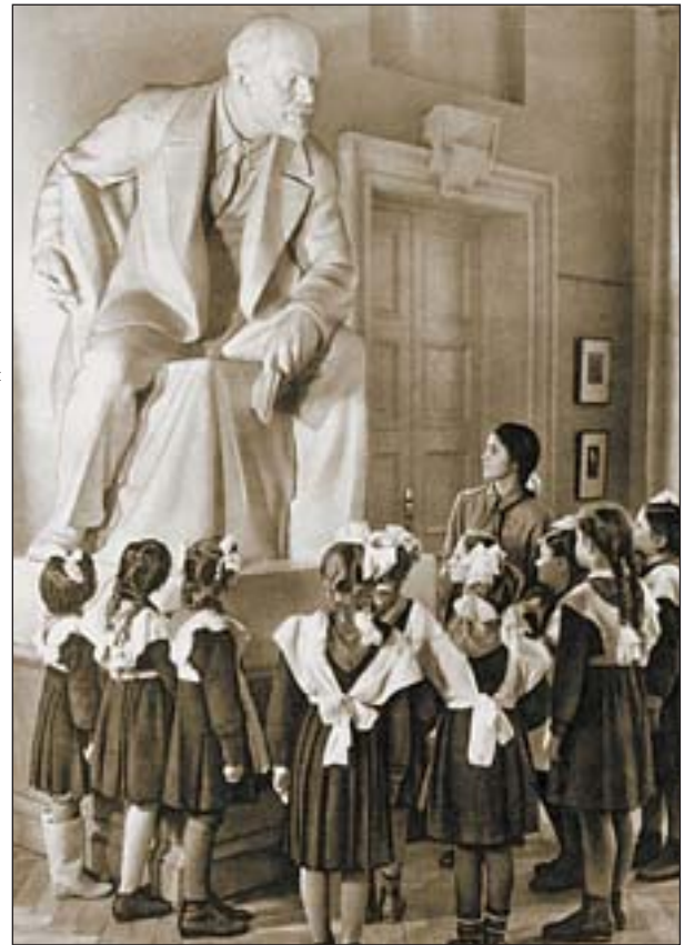
В Киевском филиале Центрального музея Ленина. 1953 г.