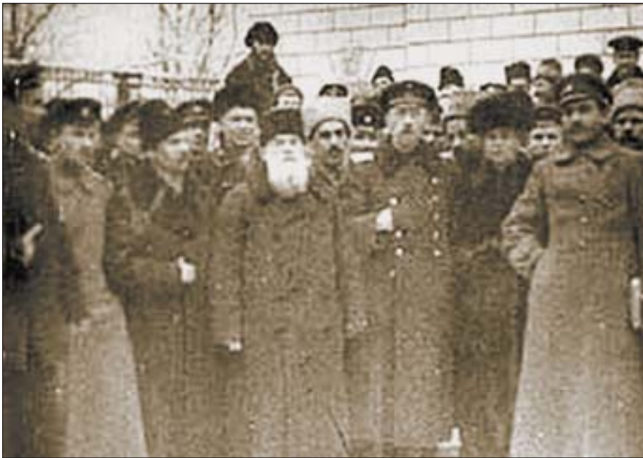
М. С. Грушевский у Педагогического музея. 1917 г.