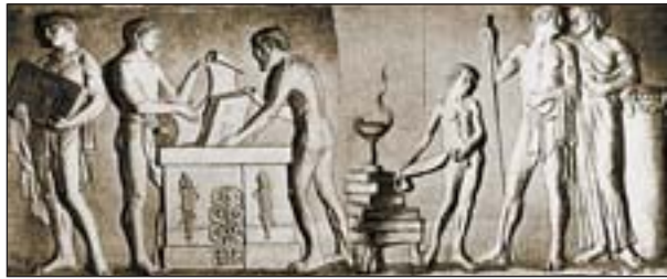
Фриз на фасаде Педагогического музея

родное образование всегда было близко моему сердцу, и я тем охотнее пойду на жертвы, чем больше пользы от учреждения могу ожидать для народа».